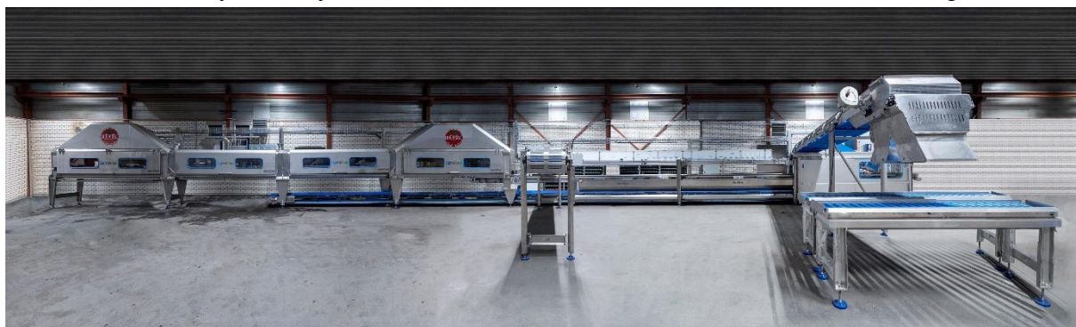
Turn Key machinelijn voor het verwerken van hydroponic geteelde gewassen