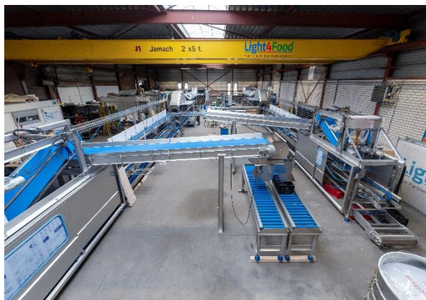
Bouwen van machinelijnen in de fabriek