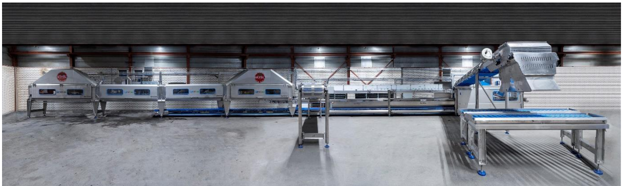
Turn Key machinelijn voor het verwerken van hydroponic geteelde gewassen