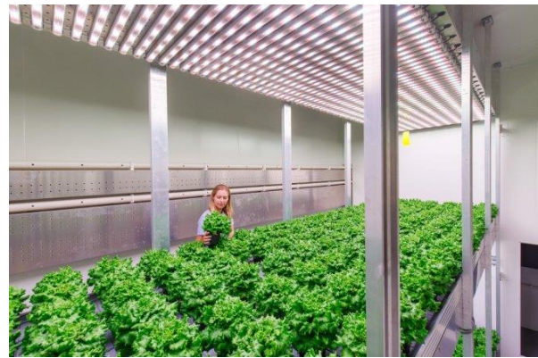
Daglichtloze teelt van sla in meerdere lagen