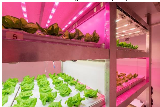
Daglichtloze teelt van sla