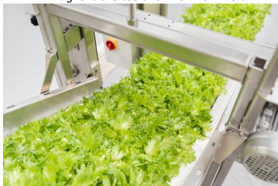
Machine voor de oogst van baby leaf sla