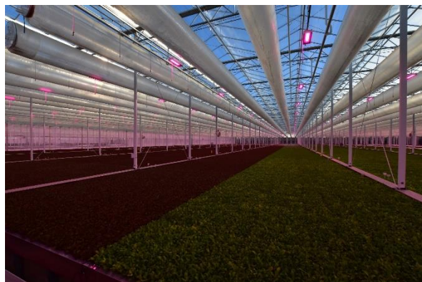
Hydroponic teelt van diverse baby leaf sla