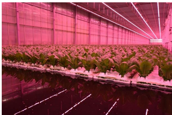
Hydroponic teelt van krop sla