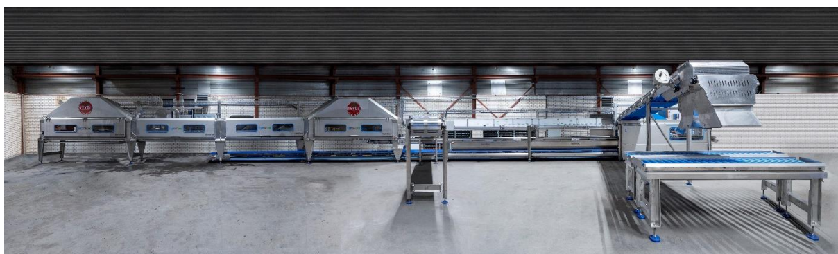
Turn Key machinelijn voor het verwerken van hydroponic geteelde gewassen