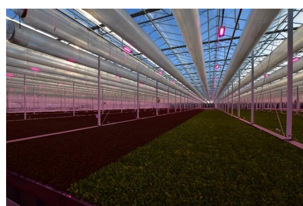
Hydroponic teelt van diverse baby leaf sla