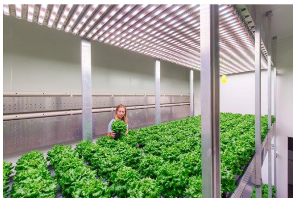
Daglichtloze teelt van sla in meerdere lagen