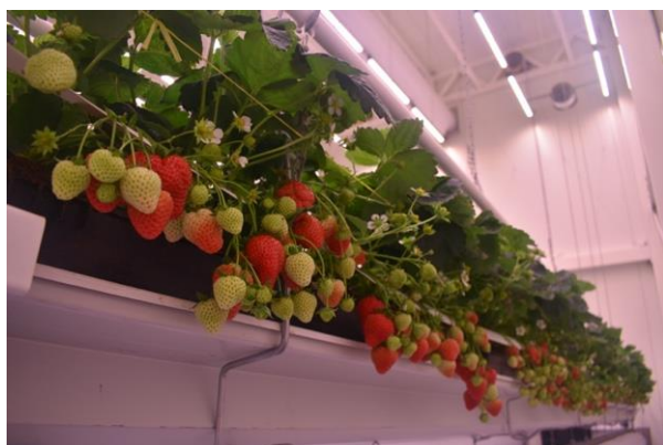
Daglichtloze aardbeienteelt in R&D cellen

Vanaf onze oprichting in 2014 zijn we doorgegroeid naar een team van 23 collega's en een vestiging in de Verenigde Staten in Houston, Texas. De vraag naar duurzame oplossingen voor de voedselproductie blijft stijgen en daarom zijn wij op zoek naar uitbreiding van ons team.