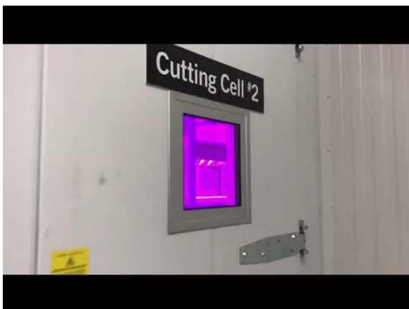
Klimaatkamer project in Las Vegas, USA