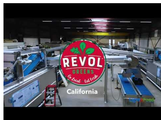
Machines voor project in California, USA