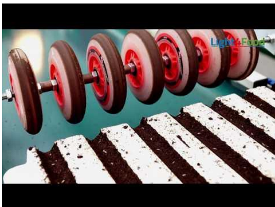
Machines en teeltsysteem in Duitsland