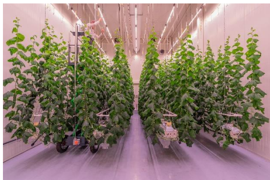
Daglichtloze teelt van komkommers

Om deze ambitie te kunnen realiseren zijn we op zoek naar aanpakkers. Groei jij met ons mee?