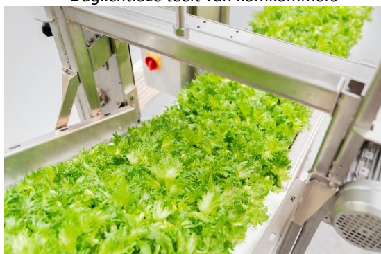
Machine voor de oogst van baby leaf sla