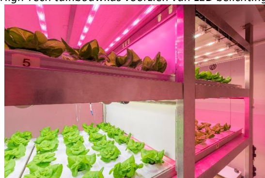
Daglichtloze teelt van sla