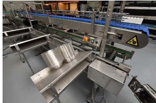
Machine voor de oogst van krop sla